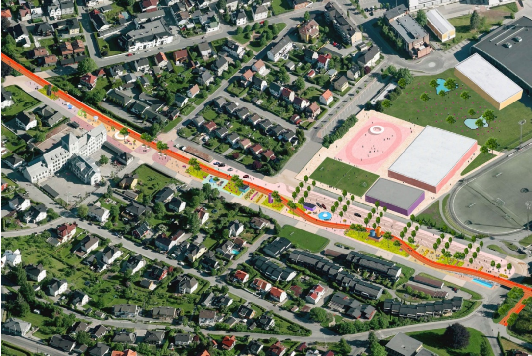
Illustrasjon fra mulighetsstudien, Gilhardi og Hellsten, 2017

I 2017 ble det laget en mulighetsstudie for bruk av den gamle jernbanetraseen som en gang- og sykkelvei, integrert i et system av by- og uterom (se illustrasjon under).